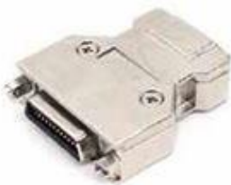
Cameralink MDR F