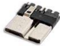
Micro USB 3.0