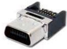
Mini Cameralink 14P